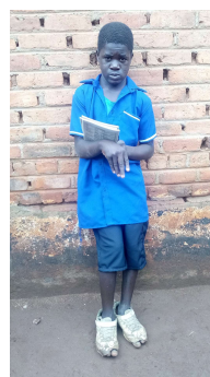
Auch ein gehandicapter Junge wird unterstützt!