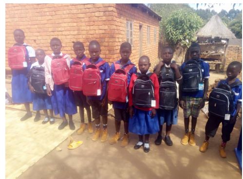
Das erste Mal einen Schulrucksack für arme Kinder in Dezda!