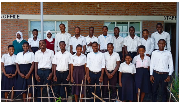
Die in Kachulu geförderten Schülerinnen und Schüler