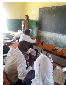
Unterricht in der Sekundarschule