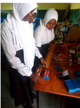
Arbeiten mit den gesponserten science Materialien in Kachulu